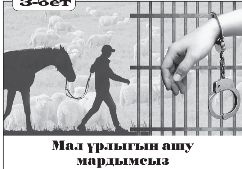
Мал ұрлығын ашу мардымсыз