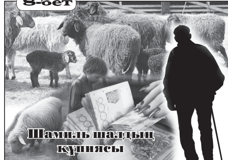
Шамиль шалдың күшпиясы