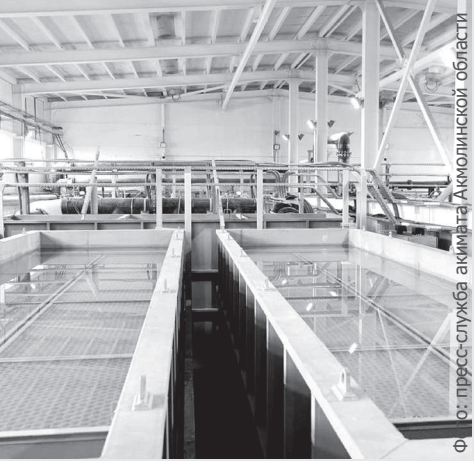
Фот. пресс-служба акимата Акмолинской области

Собственник - TOO «Медиа-корпорация «ЗАН»