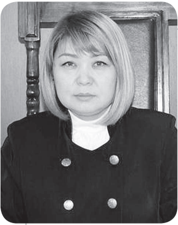
Мэншук ДЖУМАЕВА, судья Специализированного межрайонного суда по делам несовершеннолетних Мангистауской области