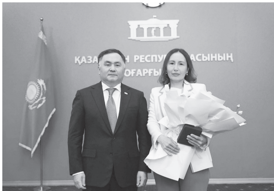
(Соңы. Басы 1-бетте)

Бұл қуанышты сәт – білікті тұлғалардың ұзақ жылдар бойы ел игілігі жолында атқарған адал еңбектері, жоғары кәсібилік пен мол тәжірибелерінің заңды жемісі. Сот саласының белді өкілдерінің әрқайсысы құқық үстемдігін қамтамасыз ету жолында табандылық танытып, әділдік қағидаттарын берік ұстанып, қоғам сеніміне ие болып келе жатқан абыройлы тұлғалар.