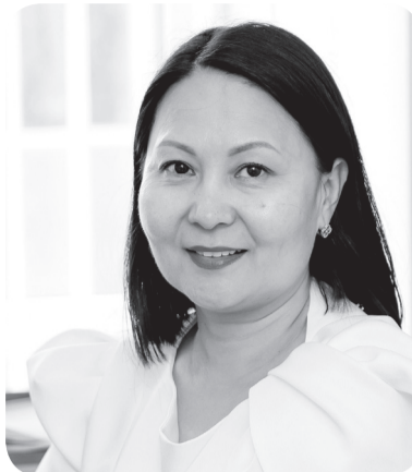
Майра САЛКЕЕВА, судья Специализированного межрайонного административного суда Костанайской области

Административное усмотрение является важнейшим элементом деятельности государственных органов в условиях современной правовой системы. В рамках Административного процедурно-процессуального кодекса Республики Казахстан данный институт получил четкое нормативное закрепление и стал предметом особого внимания, как со стороны законодателя, так и юридической науки.