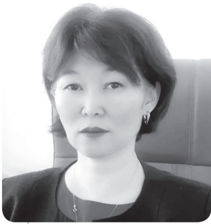
Мейрамгуль АМЕНОВА, судья Межрайонного суда города Аксу Павлодарской области