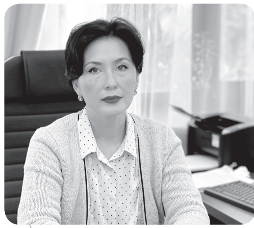
Инна ДЕМИДОВА, судья Специализированного межрайонного административного суда Карагандинской области