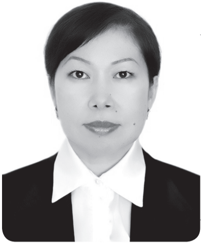
Асем РАМАЗАНОВА, судья Кассационного суда по гражданским делам

С 1 июля 2025 года в Казахстане начал работу самостоятельный Кассационный суд по гражданским делам.