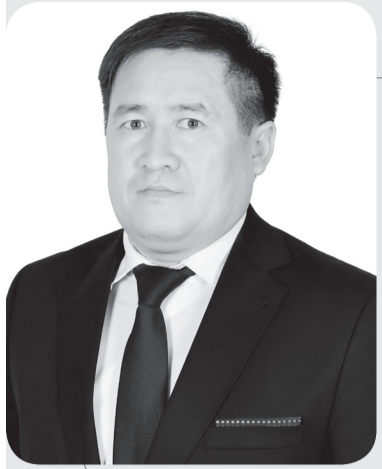
Ерлан КОСТУБАЕВ, председатель Риддерского городского суда Восточно- Казахстанской области