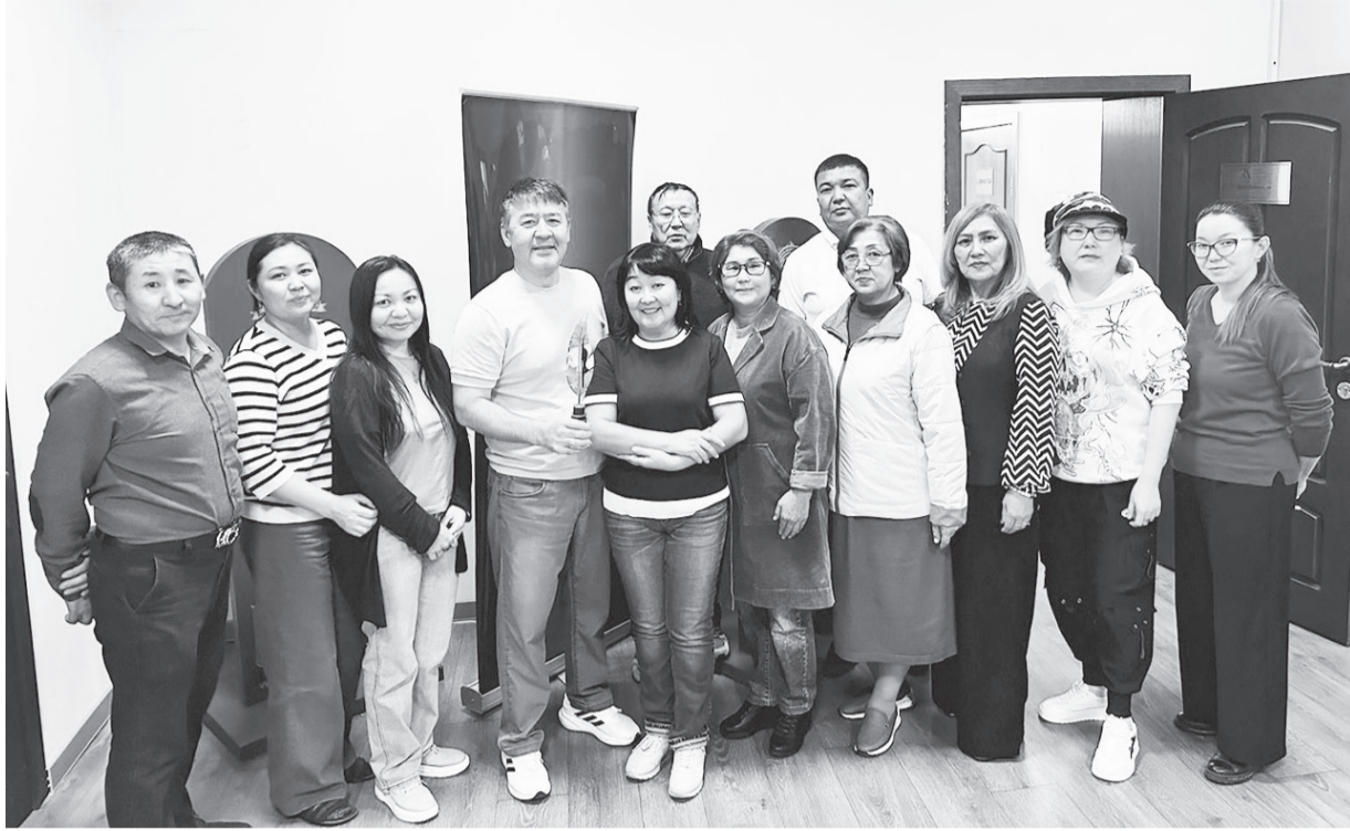
(Соңы. Басы 1-бетте)

Айта кетейік, БАҚ өкілдерінің жұмыстарын беделді журналистер, саланың еңбек сіңірген қайраткерлері мен халықаралық медиа-сарапшылардан құралған тәуелсіз қазылар алқасы бағалайды. Негізгі номинациялардан бөлек, Мәдениет және ақпарат министрі Аида Баласава «Время» газеті ұжымына арнайы сыйлықты тарту етті. Мұндай марапат балалар жазушысы Бердібек Соқпақбаевтың 100 жылдық мерейтойына орай «Заң газетіне» де бұйырды. Биылғы «ҮРКЕР» сыйлығының жеңімпаздары: 1. Жылдың үздік сұхбаты – Нұрлан Оразғалиев (Inbusiness.kz);