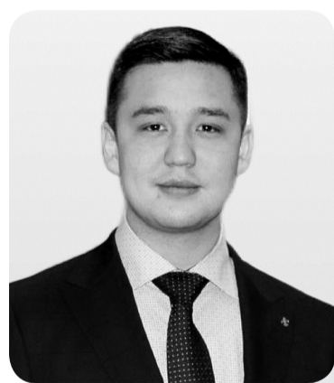
Абай ЖАРЫЛҚАСЫН, Уполномоченный по этике, заместитель руководителя Департамента судебной администрации по г. Алматы

Азартные игры и различные формы ставок продолжают оставаться социальной проблемой в Казахстане. Особое внимание здесь уделено госслужащим, на которых возложены важные функции в государственных структурах, – людям, чья ответственность и моральная устойчивость особенно значимы для общества.