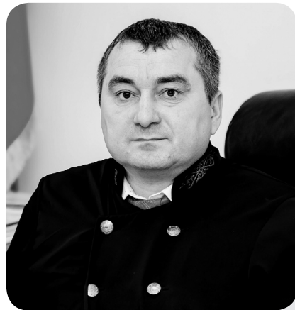
Ибрагим ДЕЗИЕВ, председатель Специализированного межрайонного административного суда Костанайской области

29 ноября 2024 года Верховным Судом РК принято Нормативное постановление №5 «О судебном решении по административным делам». Этот документ направлен на обеспечение правильного и единообразного применения норм Административного процессуального кодекса, регулирующих вынесение судебных актов по административным делам.