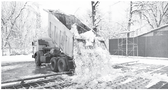
Жалпы қар еріту пунктіне Әуезов, Алмалы және Бостандық аудандарының аумақтарынан қар жеткізіледі.

— Қар еріту пунктінің жұмыс процесі қолданыстағы кәріз желісі арқылы келетін ағынды сулардың жылуын пайдалануға негізделген. Жылы су қысыммен сорғы қондырғылары және құбырлар жүйесінен өтіп, қарды ерітеді. Осыдан кейін еріген су сүзгіге түседі, құм мен қоқыстардан тазартылады. Кейін қалалық кәріз желісіне жіберіледі. Пунктінің қуаттылығы — тәулігіне 1200 текше метрге дейін қарды ерітеді, — деп хабарлады әкімдіктен.