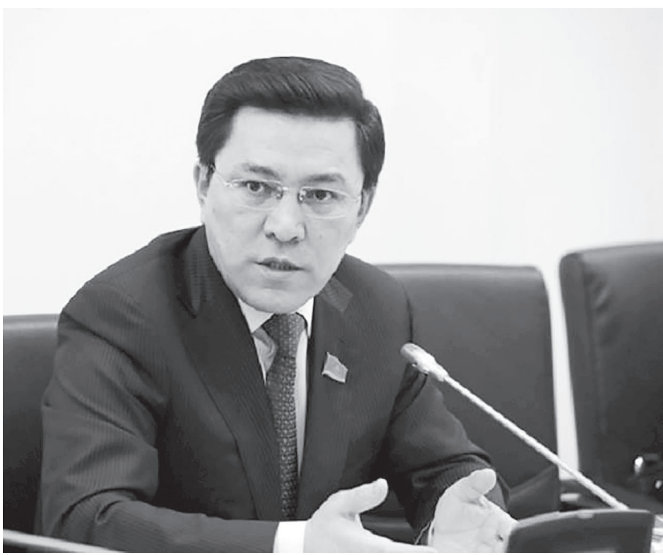
Нұртай САБИЛЬЯНОВ, Парламент Мәжілісінің депутаты:

– Иә, сатып алу құқығымен беріледі. Осы жылдың 4 қаңтарында қолданысқа енгізілген «Тұрғын үй саясаты туралы» заңда жекешелендіруге қатысты нормалар бар. Олар бұрын сатып алу құқығынсыз, жалға берілген үйлерге қатысты. Мұндай пәтерлер саны 60 мың екен. Жаңа құжат бойынша сонда тұрып жатқан адамдар оларды толықтай жекешелендіру құқына ие болып отыр. Өздерінің апатты жағдайда болған үйлерінің орнына баспана алғандар да осындай құқыққа ие болды. Кезінде көптеген мемлекеттік емес ұйымдарда немесе бұқаралық ақпарат құралдарында, қоғамдық бірлестіктерде жұмыс істеген азаматтар үйді арендаға алғанын білеміз. Олар да баспаналарын жекешелендіре алмай жүр. Өйткені, мемлекеттік қызметте