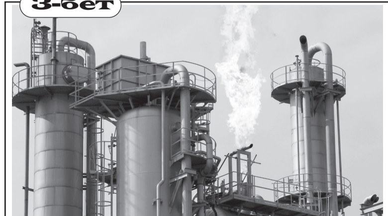
Өңдеу зауыттары – экономикалық өрлеу көзі