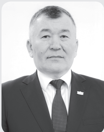
Досжан АМИР, судья Верховного Суда Республики Казахстан, Председатель Союза Судей

8 Марта – это не просто праздник, но и день выражения уважения и благодарности женщинам. Желаем Вам только радости, большого счастья и мирной жизни, еще раз поздравляем с Международным женским днем!