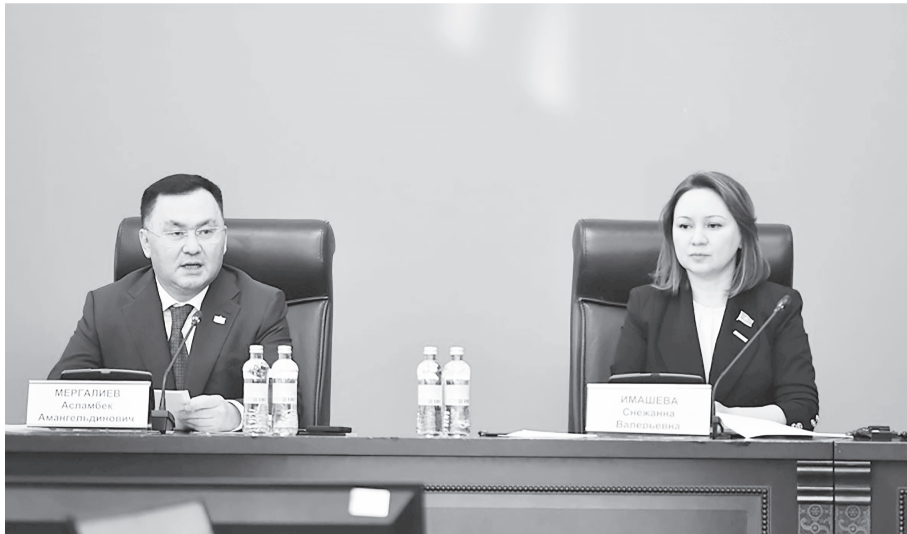
Жоғарғы Сот, Парламент Мәжілісінің Заңнама және сот-құқықтық реформа комитеті және Сот әкімшілігі «Жүргізілген сот реформасының өзекті мәселелері» тақырыбында дөңгелек үстел өткізді.

Талап Қабденовтың еліне қызмет етудегі дара жолы – еңбекқорлығы мен талапшылдығы, генералдың қызметтегі өмір жолы да көпке үлгі. Батыс Қазақстан облысы Бөкейорда ауданында туып-өскен Талап Қабденұлының балалық шағы соғыстан кейінгі жұқалтаң кезеңде өтті.