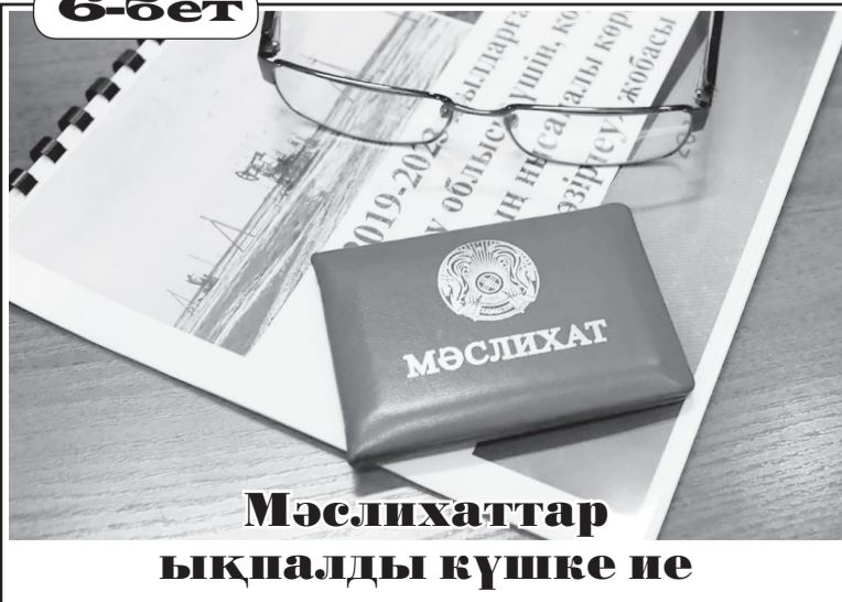
Мәслихаттар ықпалды күшке ие