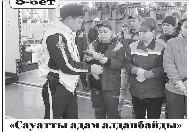
«Сауатты адам алданбайды»