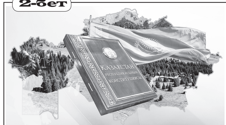
Ата Заң – тұрақтылық тірегі