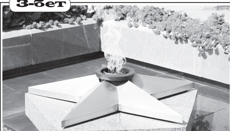
Ер есімі – ел есінде