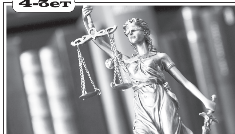
Шығынды өндіріп алу институты – құқықтық механизмнің бірі